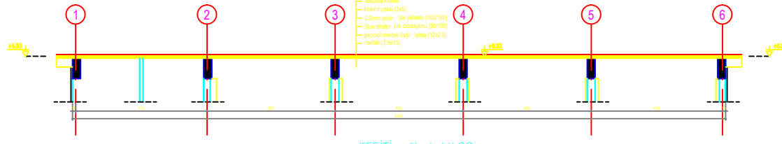
a-a KESİTİ -ölçek: 1/100-